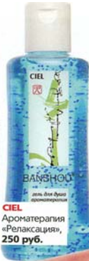
CIEL Ароматерапия «Релаксация», 250 руб.