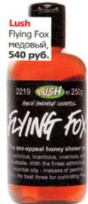
Lush Flying Fox медовый, 540 руб.