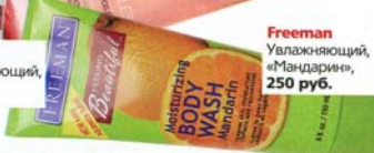
Freeman Увлажняющий, «Мандарин», 250 руб.