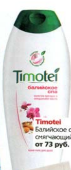
Timotei Балийское спа, от 73 руб.