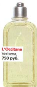
L'Occitane Verbena, 750 руб.